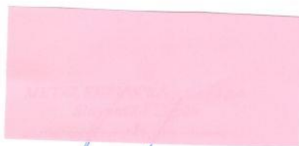
METAL SERVIS Recycling s. r. o. (Odberateľ odpadu)